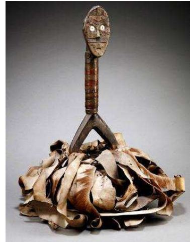
Reliquaire Bumba-Bwiti, Gabon

Son intérêt le porte alors vers les objets d'Afrique centrale (Gabon et Congo) et il acquiert un ensemble provenant du fonds du Musée Missionnaire des Orphelins d'Auteuil, regroupé à l'Abbaye de Mortain. Ces pièces réunies par des religieux au début du XXème siècle sont d'un intérêt majeur pour leur qualité plastique, leur rareté, leur ancienneté avérée par les documents d'archives qui les accompagnent et qui nous renseignent sur leurs noms vernaculaires, leurs fonctions rituelles et leur provenance.