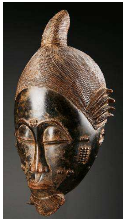
Masque Baoule, Côte d'Ivoire

Vente à l'Hôtel Drouot (salle 2) : 9 rue Drouot, 75009 Paris Mercredi 2 décembre 2009 à 19h30