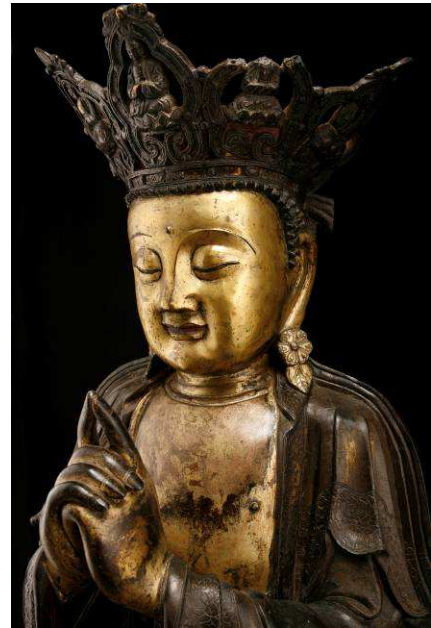
Bouddha Vairocana, bronze doré Chine, Dynastie Ming (XVI ème siècle)

Dimanche 18 octobre 2009 à l'Hôtel Drouot, Enchères Rive Gauche mettra en vente une centaine d'œuvres asiatiques de la collection Vérité.